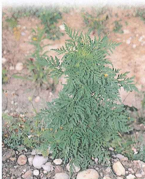
L'AMBROISIE AVANT FLORAISON