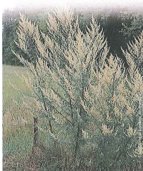
ARMOISE VULGAIRE EN FLEUR

Ne la confondez pas avec l'armoise vulgaire !